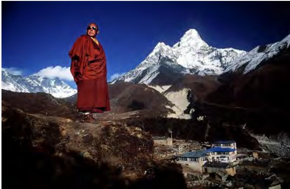
Do not mess with the Lao-to-the-Tzoo

Je kan met enkele kleine veranderingen en nieuwe gewoontes al een hoop meer gedaan krijgen. Hier zijn 10 manieren om nu onmiddellijk productiever te worden.