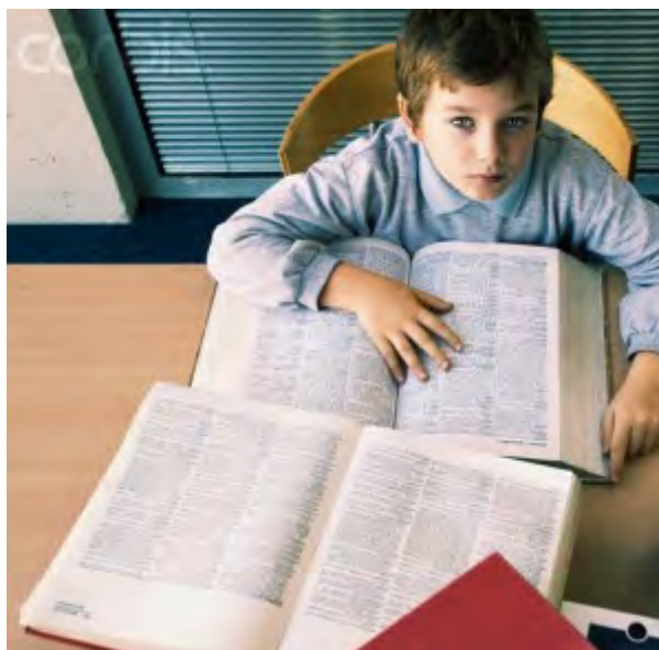
Teveel lezen over time management kan schadelijk zijn voor de productiviteit

10. Stop met lezen over hoe je je productiviteit kan verhogen. Er is een groot verschil tussen weten en kunnen. Je weet al alles dat je nodig hebt, zeker als je de Gouden Regel van Productiviteit kent. Je weet misschien hoe een auto werkt maar dat wil niet zeggen dat je hem zelf kan herstellen. Kies dus één praktisch punt en oefen tot je het KAN.